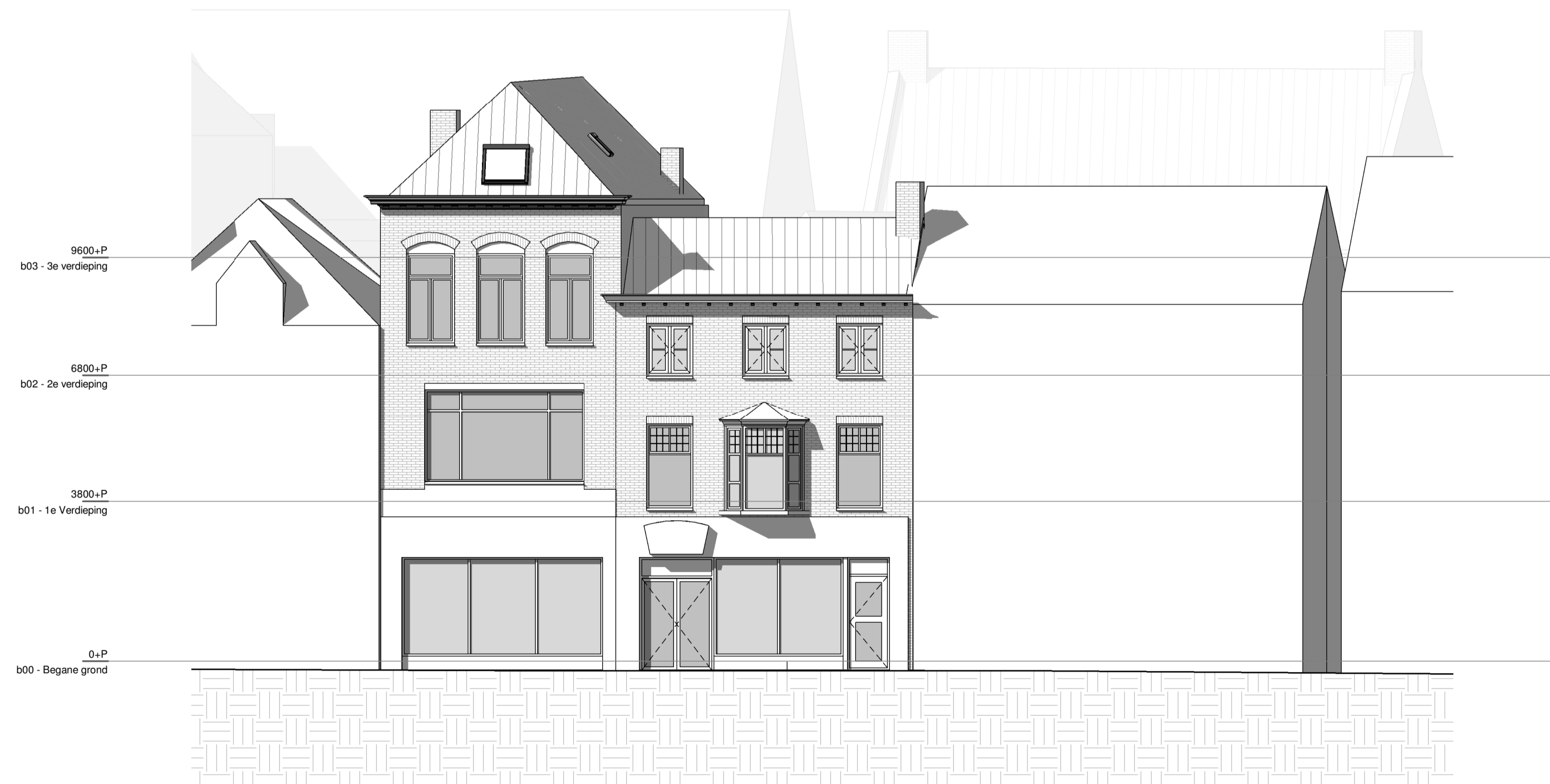
L(21)104, Oostgevel (bestaand)