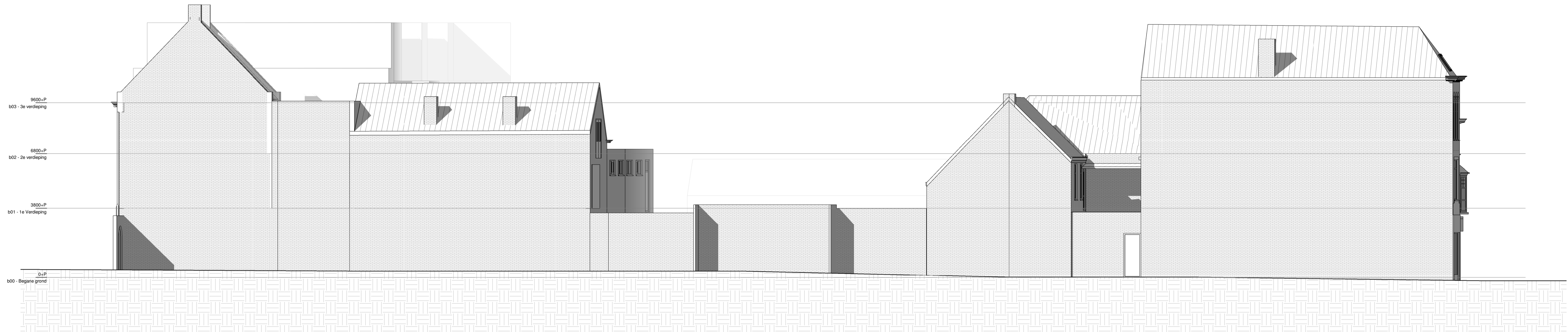
L(21)103, Zuidgevel (bestaand)