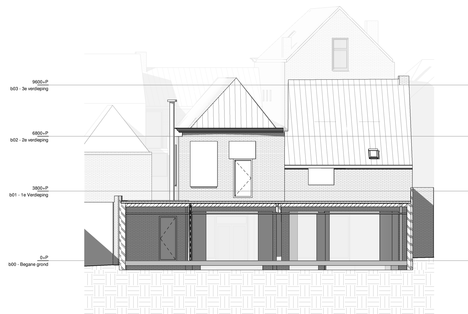
L(21)104a, Westgevel (bestaand, achterzijde)

Alle maten in het werk te controleren en bepalen!